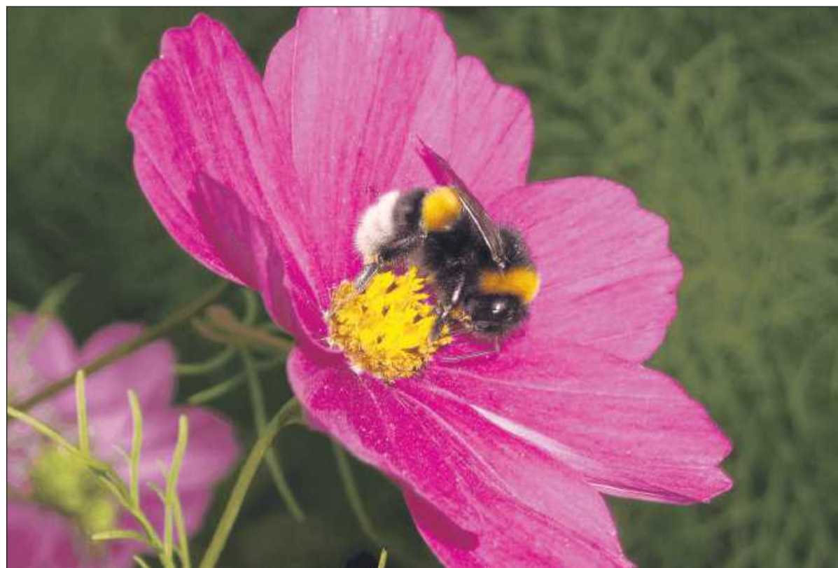
Hummeln sind effektive Bestäuber: In ihrem Pelz bleibt immer etwas hängen.

Die Hummel zählt, bis auf einige solitär lebende Arten, zu den sozialen